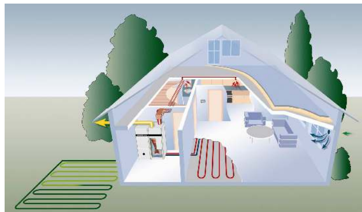
Η Αντλία Θερμότητας Εδάφους / Νερού της Dimplex αντλεί ενέργεια από το υπέδαφος (κώμα, νερό) προσφέροντας τη δυνατότητα θέρμανσης και ψύξης εσωτερικών χώρων με εξοικονόμηση ενέργειας από 55-65%.

Αυτή ακριβώς τη διαφορά θερμοκρασίας, μεταξύ του εξωτερικού αέρα του περιβάλλοντος και του υπεδάφους εκμεταλλευόμαστε με τη χρήση Γεωθερμικού συστήματος, για να Ψύξουμε ή να Θερμάνουμε το κτίριο και να μειώσουμε την εγκατεστημένη ηλεκτρική ισχύ ώστε να εξοικονομήσουμε ενέργεια.