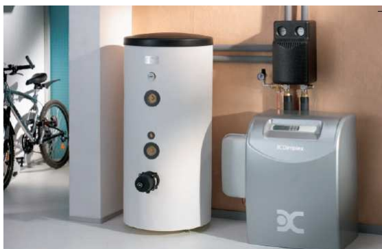
Εγκατεστημένο Γεωθερμικό σύστημα Dimplex

Το εντυπωσιακό είναι όμως το ενδιαφέρον του κόσμου και των συνεργατών μας για απεξάρτηση από το πετρέλαιο και οικονομία στην κατανάλωση. Είμαστε βέβαιοι από τα στοιχεία που έχουμε και από τα έργα που βρίσκονται ακόμα στην μελέτη ότι μέχρι του χρόνου θα έχουμε να επιδείξουμε δεκάδες εφαρμογές γεωθερμικού κλιματισμού στον ελλαδικό χώρο αλλά και στην Κύπρο.