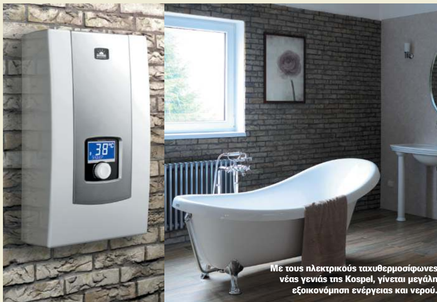
Με τους ηλεκτρικούς ταχυθερμοσίφωνες νέας γενιάς της Kospel, γίνεται μεγάλη εξοικονόμηση ενέργειας και νερού.

σας χωρίς πετρέλαιο" όπως η ηλεκτρική ενδοδαπέδια. Τα συστήματα αυτά ανοίγουν νέες προοπτικές για ποιοτικώς καλύτερη θέρμανση, με εξοικονόμηση χώρου, λειτουργικών και συντήρησης και βρίσκουν εφαρμογή ακόμα και σε μεμονωμένους χώρους όπως τα γραφεία ή μπάνια. Ένα άλλο γνωστό και παρεξηγημένο προϊόν μας είναι οι θερμοσυσσωρευτές που όλοι γνωρίζουμε την οικονομική του λειτουργία αξιοποιώντας το νυχτερινό τιμολόγιο . Τώρα τελευταία παρουσιάζει μεγάλη αύξηση των πωλήσεων μας λόγω και των αντικαταστάσεων παλαιών ύστερα από 30 χρόνια λειτουργίας . Τέλος ένας ποιοτικός θερμοπομπός μπορεί να καλύψει ανάγκες θέρμανσης ενός πολύ μικρού χώρου ή κάποιου εξοχικού οικονομικά και χωρίς προβλήματα συντήρησης. Οι ενδιαφερόμενοι μπορούν να πληροφορηθούν περισσότερα από την ιστοσελίδα μας και την τεχνική μας υπηρεσία.