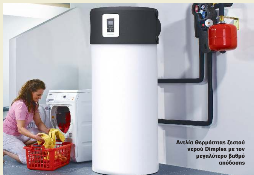
Αντλία Θερμότητας ζεστού νερού Dimplex με τον μεγαλύτερο βαθμό απόδοσης

Για να απαντήσω λοιπόν στην σωστή σας παρατήρηση, οι Αντλίες Θερμότητας για εμάς έχουν ιδιαίτερη σημασία καθώς αποτελούν την πιο σύγχρονη τεχνολογία για την θέρμανση και ψύξη ενός κυρίου και φυσικά επειδή νιώθουμε σίγουροι για την ποιοτική ανωτερότητα της DIMPLEX