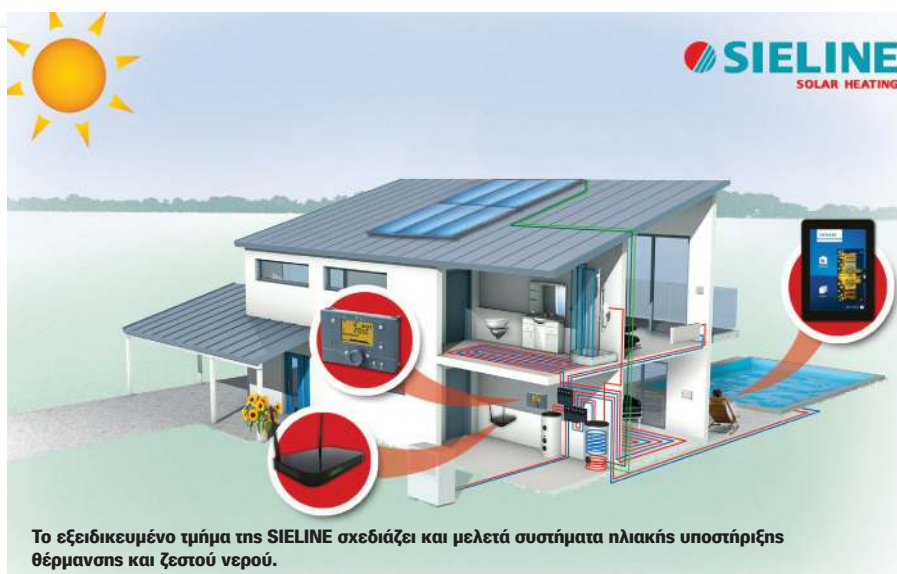
Το εξειδικευμένο τμήμα της SIELINE σχεδιάζει και μελετά συστήματα ηλιακής υποστήριξης θέρμανσης και ζεστού νερού.

Η SIELINE είναι ήδη μπροστά σε αυτόν τον τομέα, ενημερώνουμε τόσο τις τουριστικές όσο και τις κατασκευαστικές εταιρείες με ειδικές μελέτες για τα οφέλη που θα