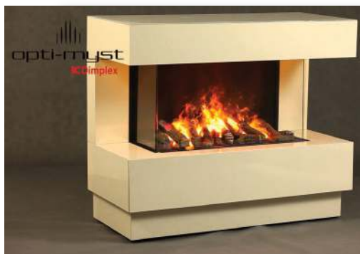
Τα ηλεκτρικά τζάκια Dimplex προσφέρουν καταρκήν ατμόσφαιρα και άπιστευτο ρεαλισμό χωρίς ρύπους και ακαθαρσίες

Ένα δεύτερο παράδειγμα είναι τα ηλεκτρικά τζάκια . Μόνο στην Ατική υπάρχουν πάνω από 300.000 κατοικίες που διαθέτουν τζάκια και δεν το χρησιμοποιούν . Η χρήση δε όλων των άλλων τζακιών δημιουργεί αρκετά προβλήματα τόσο μέσα στα σπίτια μας όσο και στο περιβάλλον γενικότερα. Είναι υπεύθυνα για το φαινόμενο της αιθαλομίχλης πάνω από τα μεγάλα αστικά κέντρα αλλά και για αναπνευστικά και άλλα προβλήματα υγείας που συνδέονται με την ποιότητα του αέρα που αναπνέουμε. Ήδη μεγάλες ευρωπαϊκές πόλεις έχουν πάρει μέτρα κατάργησης της χρήσης ξύλου ως καύσιμη ύλη στο τζάκι. Η DIMPLEX είναι πρωτοπόρος