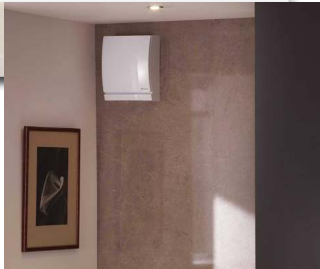
Έξυπνη λύση τοπικού εξαερισμού Xpelair, που αφαιρεί αυτόματα τον χρησιμοποιημένο εσωτερικό αέρα – παράλληλα φέρνει φρέσκο φιλτραρισμένο με οξυγόνο, διατηρώντας τη θερμοκρασία του χώρου σταθερή.

Για να σας δώσω ένα παράδειγμα, βάζοντας ένα σύστημα μη-