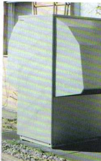
Αντλία θερμότητας Glen Dimplex σε οικιακή εγκατάσταση στη Γερμανία.

Η αντλία θερμότητας αέρα - νερού χρησιμοποιεί σαν πηγή ενέργειας τον αέρα του περιβάλλοντος.