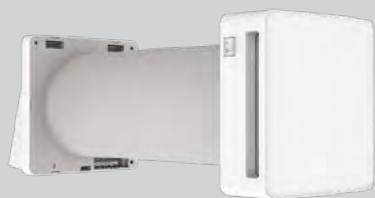
Tempero Eco Active